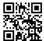
特別区消防団 HP QRコード

特別区の消防団では、消防団員募集用ポスターやリーフレットを制作するとともに、平成30年11月1日から特別区消防団ホームページを開設し、消防団の活動紹介を行うなど、消防団員の入団促進を図っています。