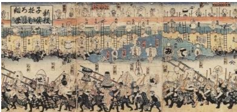
【新板子供遊いろは組学】 (消防博物館所蔵)