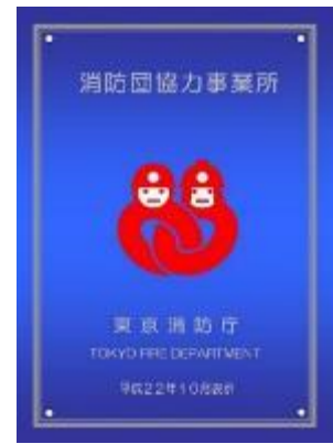
消防団協力事業所表示証

特別区の消防団協力事業所表示制度についての情報は、特別区消防団ホームページ「トップ」→「特別区の消防団事業所表示制度について」に掲載されています。