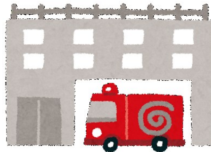
届出対象の建物を 管轄する消防署 (分署や出張所の場合もあります)