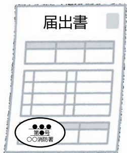
届出書の副本 (消防署の登録印付き)