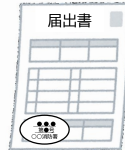
届出書の副本 (登録印付き)