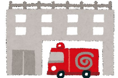
設置対象の建物を 管轄する消防署