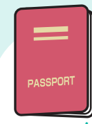
พาสปอร์ต

สิ่งของที่ต้องเตรียมหลังจากโทรแจ้งรถพยาบาลไปแล้ว