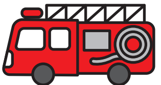
รถดับเพลิง