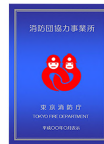
消防団協力事業所表示証