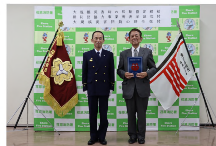
消防団協力事業所表示証の交付