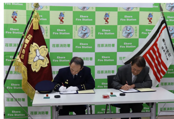
震災時の活動協定締結