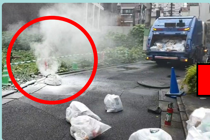
可燃ごみ回収中、ごみ袋から煙!!