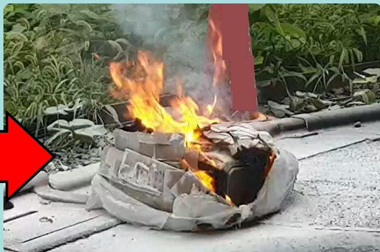
ごみ袋からバッテリー!?