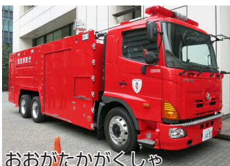
おおがたかがくしゃ

詳しくは、お近くの消防署にあるリーフレット、または東京消防庁ホームページ「地震に備えて」をご覧ください。