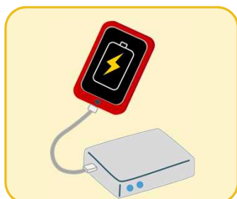
モバイルバッテリー (リチウムイオン電池)