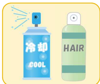
スプレー缶 (エアゾール製品)