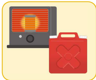
ストーブの燃料 (灯油)