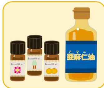
アロマオイル、 動植物油