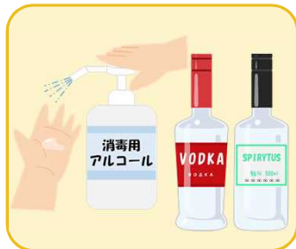
消毒用アルコール、 度数が高い酒類