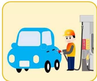
車の燃料 (ガソリン、軽油)